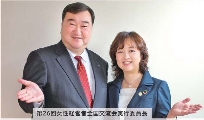
第26回女性経営者全国交流会実行委員長